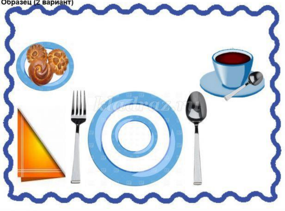
Образец (2 вариант)